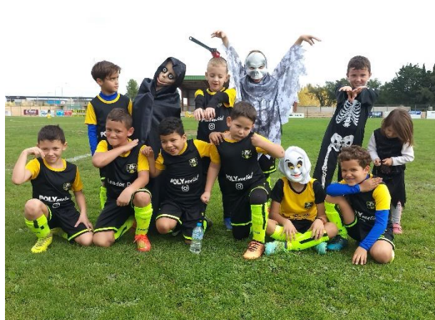
Plateau U9 à Thuir équipe de PEYRESTORTES