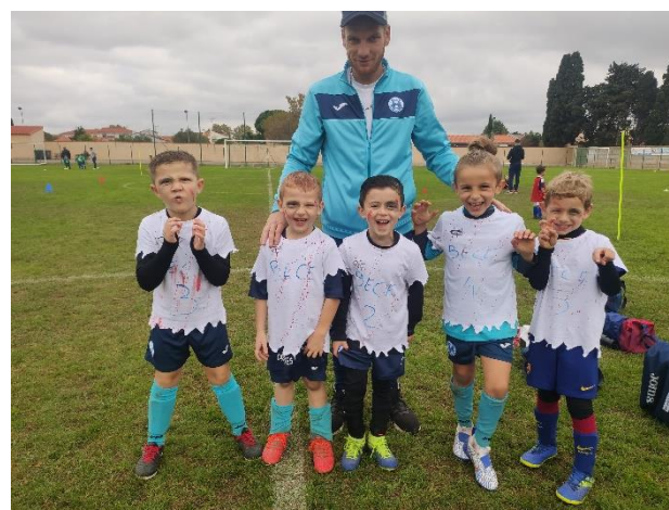
Plateau U7 à Rivesaltes équipe du FC BECE