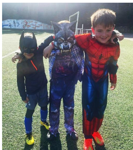
Plateau U7 à Céret équipe de LATOUR BAS ELNE