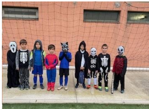
Plateau U9 au Pac équipe de l'US BOMPAS