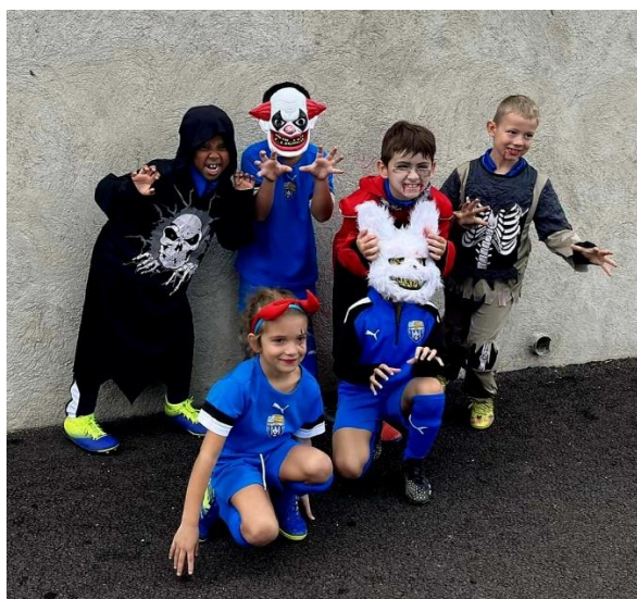
Plateau U9 à Banyuls équipe du FC ST CYPRIEN

Les photos gagnantes du concours "la photo qui fait peur"