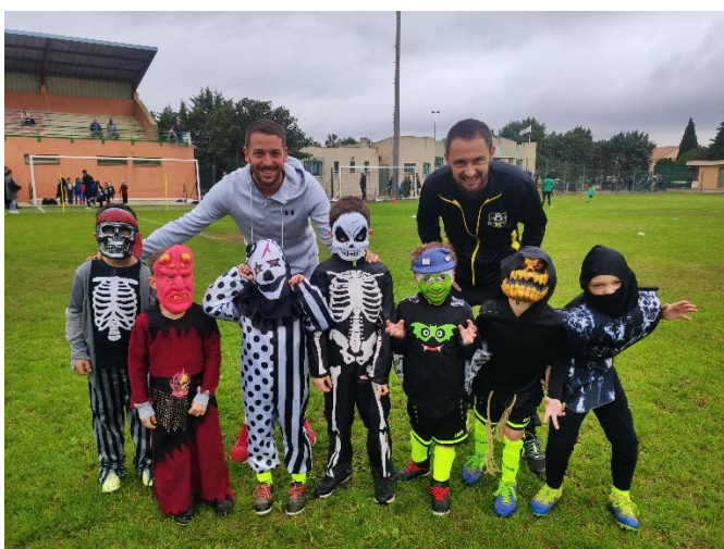
Plateau U7 à Rivesaltes équipe de PEYRESTORTES