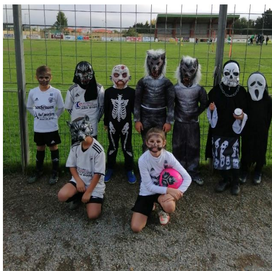
Plateau U9 à Thuir équipe de LE SOLER