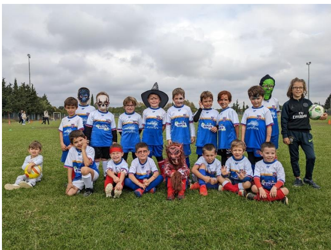
Plateau U7 à Villeneuve/Rivière équipe de BAHO-PEZILLA