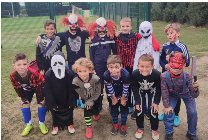
Plateau U9 à Saleilles équipe de LATOUR BAS ELNE