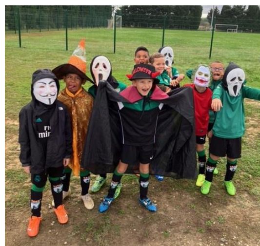
Plateau U9 à Saleilles équipe de SALEILLES OC