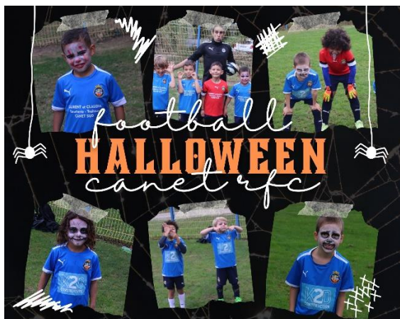
Plateau U7 à Canet – équipe de CANET RFC