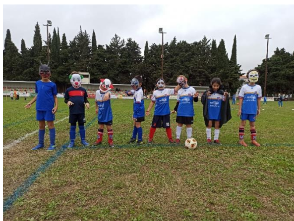
Plateau U9 à BAHO équipe du FC BAHO-PEZILLA