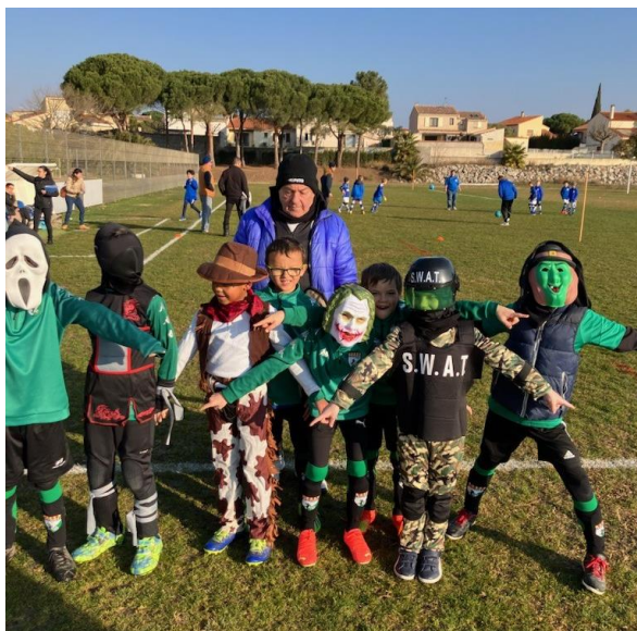
U9 SALEILLES OC