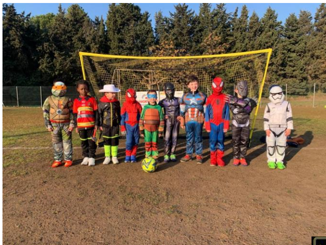
U7 AS PEYRESTORTES