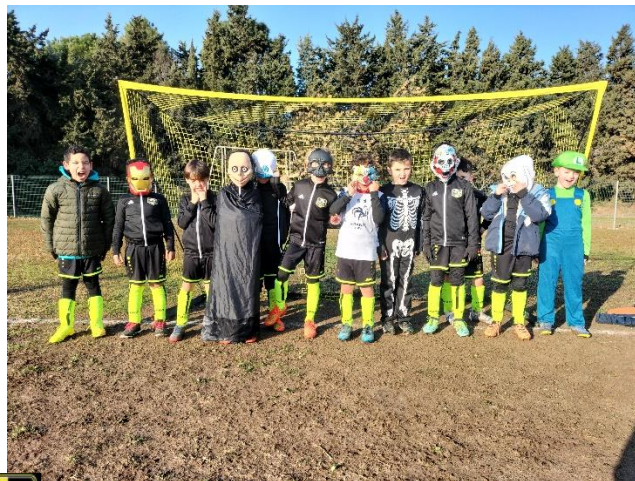
U9 AS PEYRESTORTES