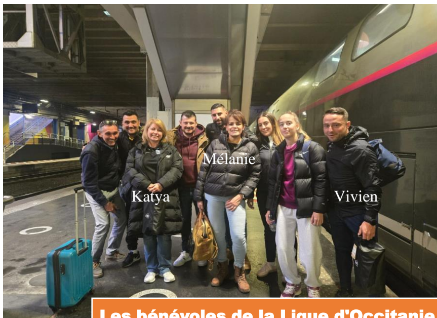
Les bénévoles de la Ligue d'Occitanie en route pour Clairefontaine !